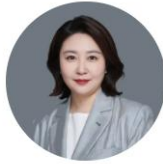
海澜 北京国枫律师事务所 合伙人 业务专长 公司法律事务 争议解决、投资并购